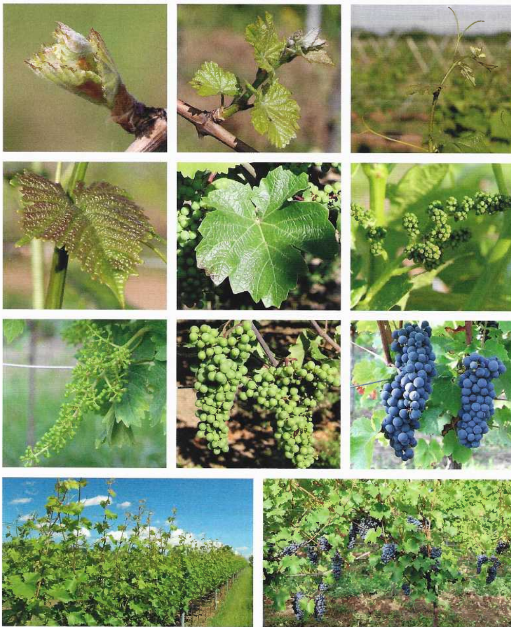
Knospenaufbruch (2-1), Drei-Blatt- Stadium (2-2), Triebspitze (2-3), junges Blatt (2-4), ausgewachsenes Blatt (2-5), Geschein (2-6), Traube Schrotkorngröße (2-7), Trauben Erbsengröße (2-8), Trauben vollreif (2-9), ausgewachsene Laubwand zum Zeitpunkt Blüte (2-10), Erntereifer Stock (2-11).

duktion der Pflanzenschutzmaßnahmen, je nach Produktionsziel, Wirtschaftsweise und jahrgangsbedingten Spritzfolgen mit Neuen Rebsorten bei durchschnittlichen Erträgen lassen sich etwa 0,10 bis 0,15 Euro Produktionskosten je Liter Wein einsparen.