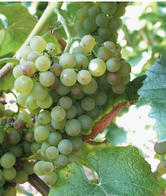
Solaris ist eine sehr frühreife Sorte mit hohen Mostgewichten und wird gerne für den ersten Federweißen verwendet.