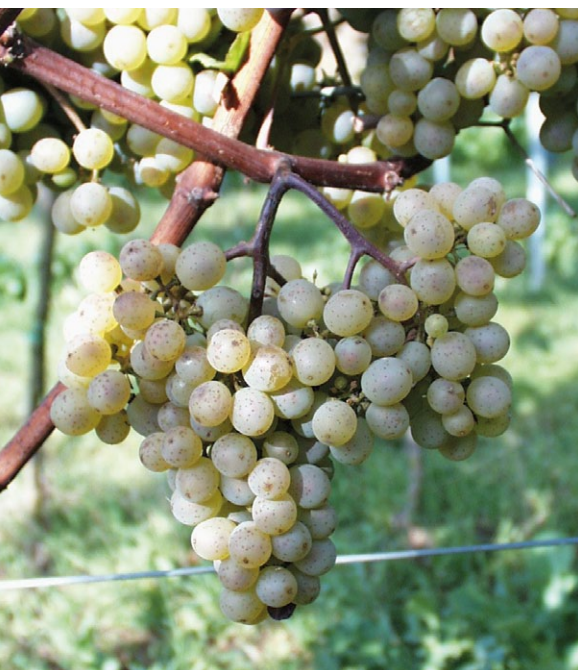
Die Geisenheimer Züchtung Prinzpal besitzt Riesling-Charakter.

net-Typ (alle rot): Cabernet Carbon, Cabernet Carol, Cabernet Cortis, Cabernet Cantor; Frucht-Typ: Baron, Monarch und Piroso sind rot, Solaris* und Johanniter* sind weiß; Neutral-Typ: Merzling*, Helios*, Bronner* sind weiß, Prior ist rot. Neu zugelassen: Muscaris und Sauvignier gris