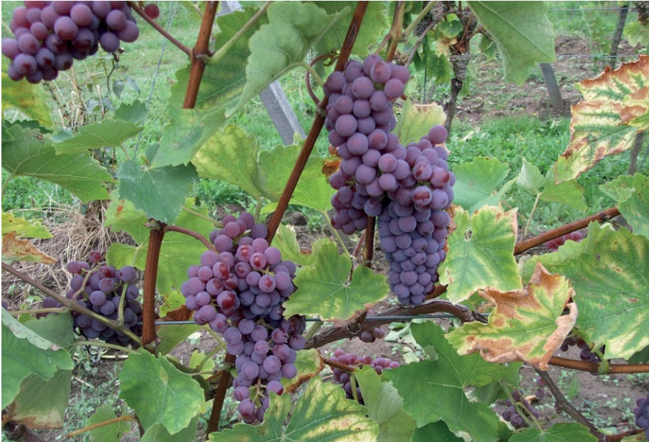
Der Souvignier gris besitzt eine rosafarbene Beerenhaut und ist vom Weintyp mit den weißen Burgundern vergleichbar.