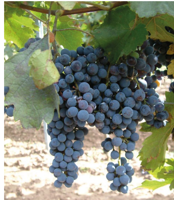
Cabernet Carbon ist eine Freiburger Rebsorte mit einer nur mittlerer Oidiumresistenz.