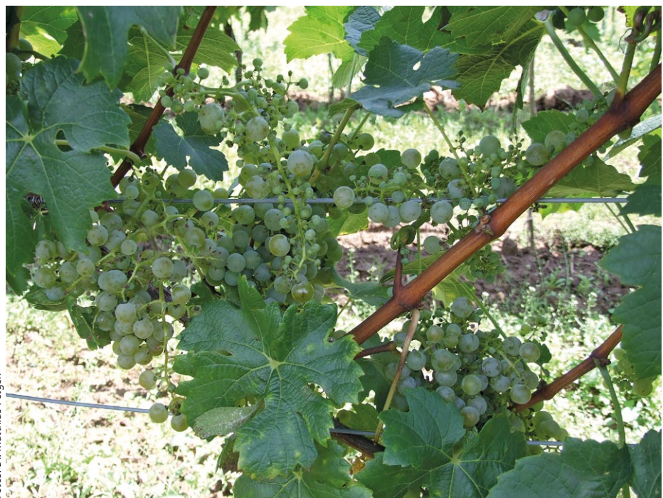
Auf einer Fläche von 62,5 ha wird bereits der Cabernet blanc in der Pfalz angebaut – die Sorte besitzt eine hohe Neigung zum Verrieseln.

Zusammenfassend kann gesagt werden, dass aus weinbaulicher Sicht viele interessante pilzfeste Sorten zur Verfügung stehen, die das Angebot in den Betrieben bereichern könnten. Die Pilzfestigkeit ist teilweise unterschiedlich, zwei bis drei Spritzungen sind aus Sicherheitsgründen angebracht. Nun gilt es das Interesse der Verbraucher für diese innovativen Sorten mit überzeugenden Weinqualitäten zu wecken, die Nischen im Angebot besetzen, die mit dem bisherigen Angebot noch nicht abgedeckt wurden. ■