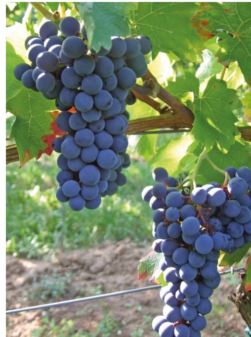
Die rote VB-Sorte Cabertin erinnert deutlich an ein Kreuzungselternteil, den Cabernet Sauvignon.

Die neuen pilzfesten Sorten des Züchters Valentin Blattner werden mit großem Interesse von der Praxis verfolgt. Bereits seit 1990 arbeitet die Familie Valentin Blattner aus dem Kanton Jura in der Schweiz mit pilzwiderstandsfähigen Rebsorten. Die weiße Sorte Cabernet blanc mit der früheren Zucht- nummer VB 91-26-1 zeigt eine gute Widerstandsfähigkeit gegen Oidium, Peronospora und Botrytis. Die Traube ist gemischtbeerig, das heißt normalgroße und jungfernfrüchtige Beeren kommen abwechselnd vor. Der Wuchs ist kräftig, die Laubwand ist trotzdem aufgelockert. Die Verrieselungsanfälligkeit gilt als