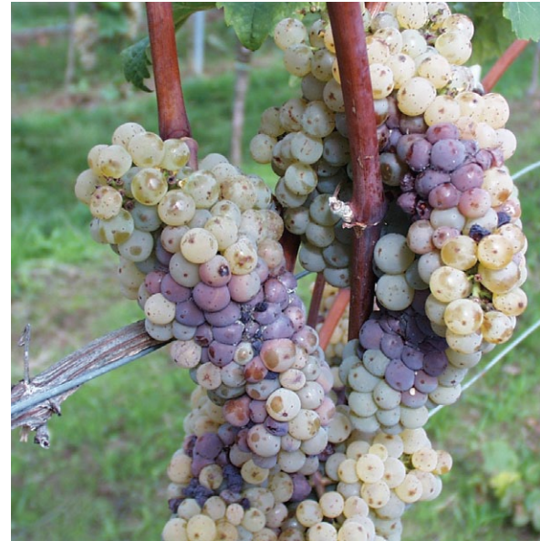
Johanniter – längliche Traubenstruktur mit kompaktem Mittelteil, was zu Botrytis führen kann.

Der Souvignier gris ist eine Kreuzung aus Cabernet Sauvignon x Bronner, die 1983 von Norbert Becker in Freiburg gezüchtet wurde. Die weinbaulichen Eigenschaften sind mit den weißen Burgundersorten vergleichbar. Die Sorte besitzt eine sehr hohe Peronosporafestigkeit und neigt nur zu einer geringen Verrieselung. Der Weintyp wird als kräftig, neutral bis leicht fruchtig beschrieben. Die Sorte darf nicht mit Sauvignon gris verwechselt werden. Diese wird verstärkt in der Schweiz angebaut und ist vom Weintyp her vergleichbar mit dem Sauvignon blanc, besitzt allerdings auch eine rosafarbene Beerenhaut.